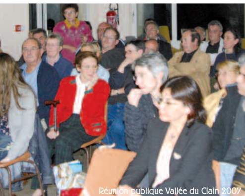
Réunion publique Vallée du Clain 2007

Le Conseil de quartier est un nouvel outil de concertation et de démocratie locale. Sa création est facultative dans les communes de 20 000 à 80 000 habitants. C'est un lieu